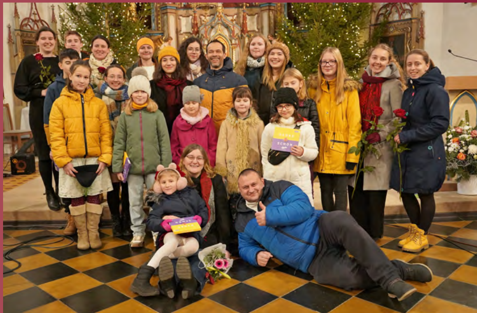
První koncert dětské Scholy 28. 12. 2025