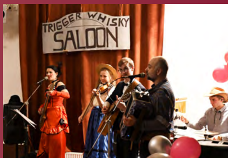
Orelsko-farní maškarní ples 31. 1. 2026

Zadní strana: Představení dětí připravujících se ke svátostem 15. 2. 2026