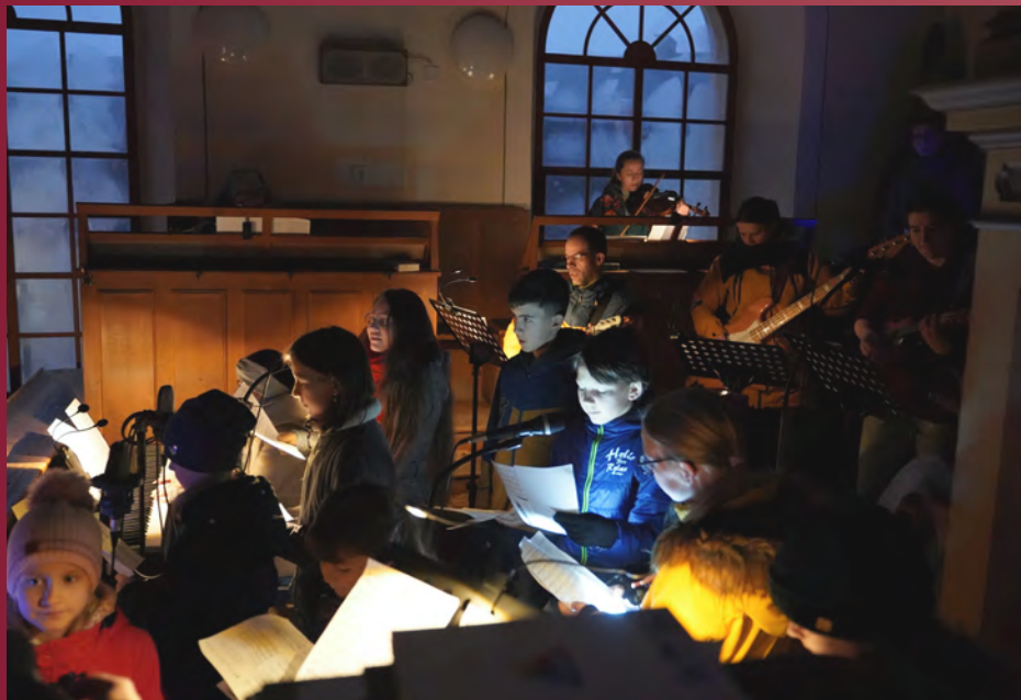
Rorátní mše svatá pro děti 13. 12. 2025