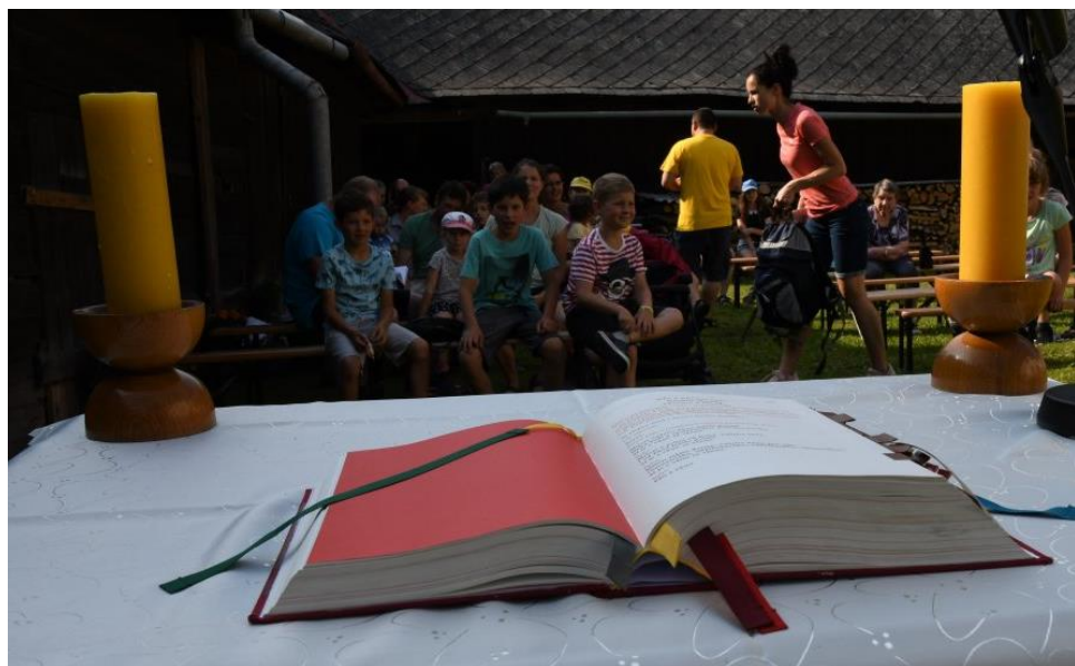
Zakončení školního roku na farním dvoře (středa 23. 6. 2021)