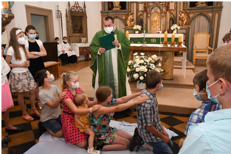
Promluva pro děti a den otců (20. 6. 2021)