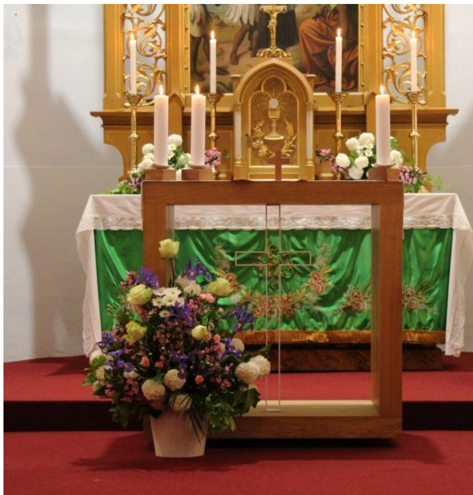
VERNEŘOVICE SV. JÁN KŘTEL