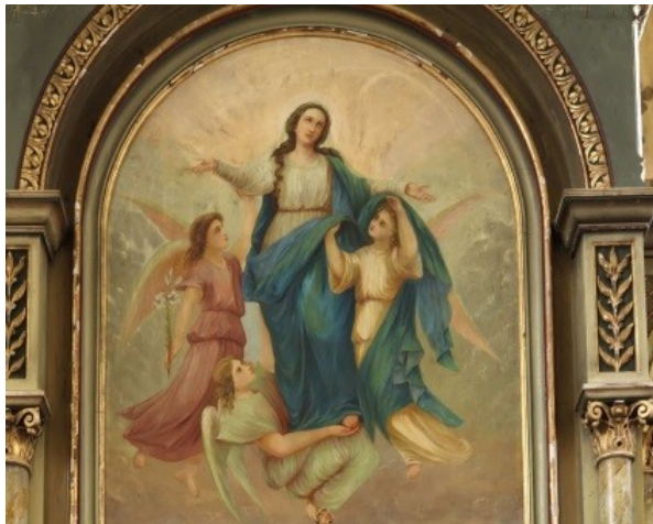
Oltářní obraz Nanebevzetí Panny Marie ve Vraclavi

15. srpna každoročně slavíme Slavnost Nanebevzetí Panny Marie. Termín „nanebevzetí“ znamená, že Matka Boží byla vzata do nebe s tělem i duší, neboť její duše ani tělo nebyly nikdy poskvrněny dědičným ani osobním hříchem. Mariino nanebevzetí prohlásil za článek víry (dogma) papež Pius XII. v roce 1952 a tímto aktem, zveřejněným Apoštolskou konstitucí Munificentissimus Deus , stanovil pro všechny katolíky povinnost přijmout tuto pravdu víry za svou a osobně v ní věřit. Potvrdil tak mnohasetletou tradicí víry Církve.