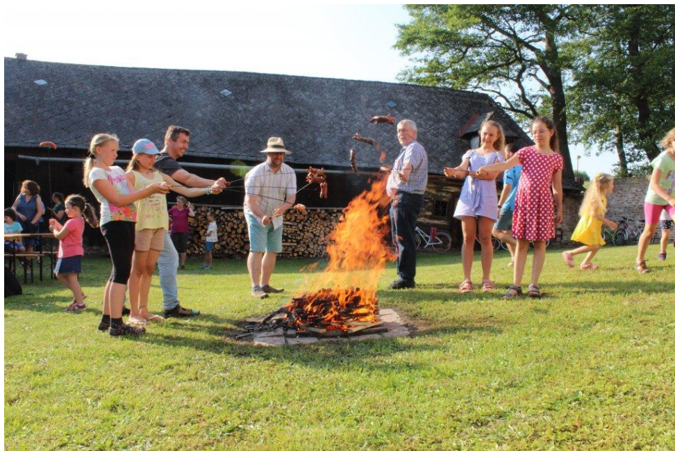
Zakončení školního roku na farním dvoře (středa 23. 6. 2021)