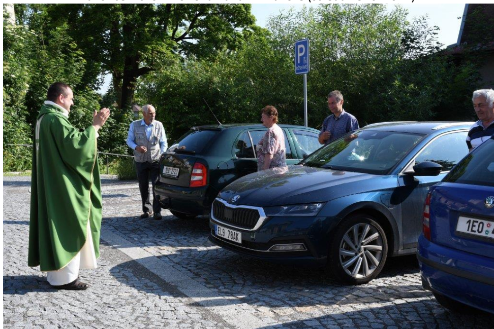
Žehnání dopravních prostředků a prázdninových cest (27.6.2021)