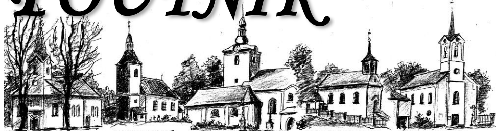
HORŇÍ ČERMÁNŮ – MARIÁNSKÁ HORA POUTNÍ KOSTEL – NAROZENÍ P. MARIE