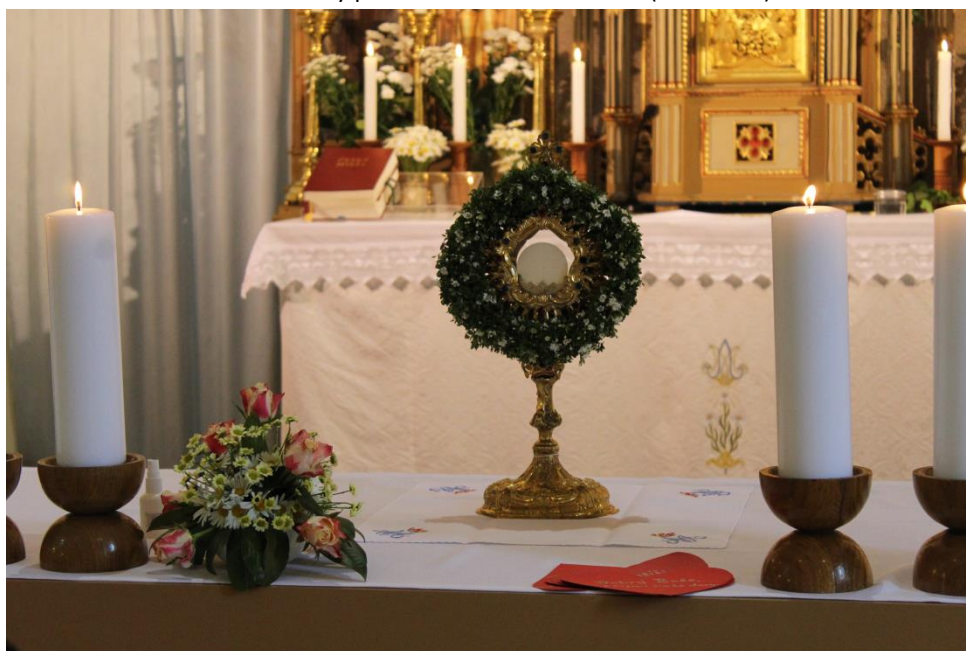
Nejsvětější Svátost na novém oltáři (6. 6. 2021)