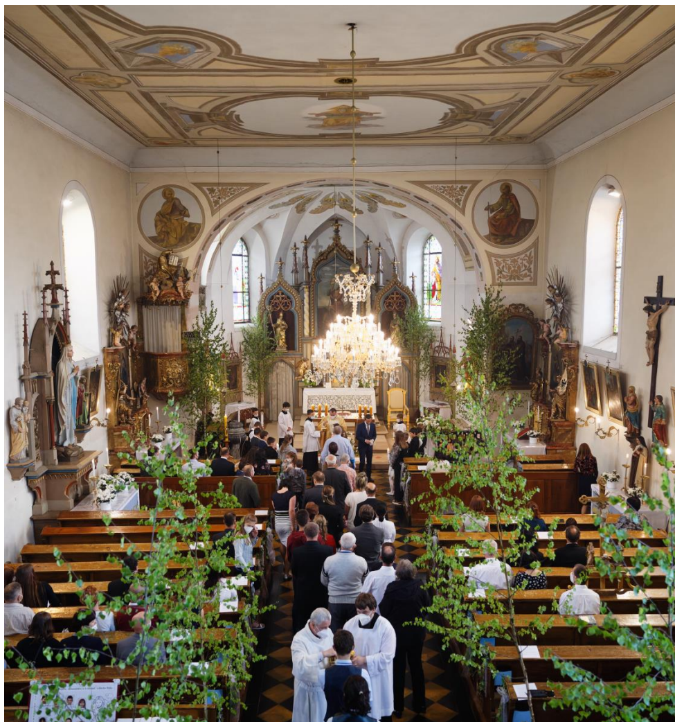
VERNEŘOVICE – SV. JÁN KŘTEL