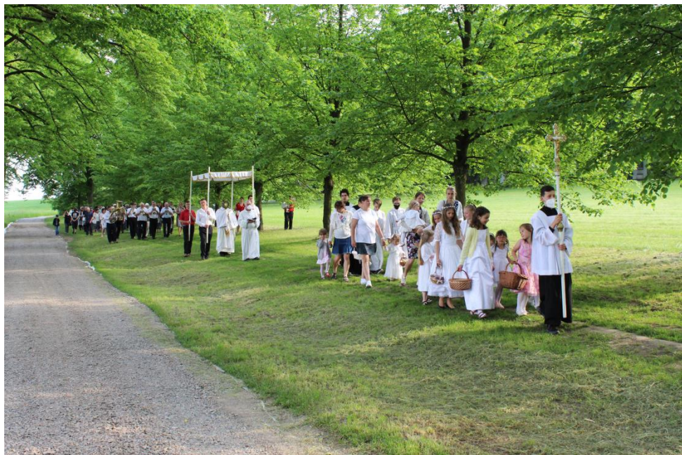
Eucharistický průvod na Mariánské Hoře (6. 6. 2021)