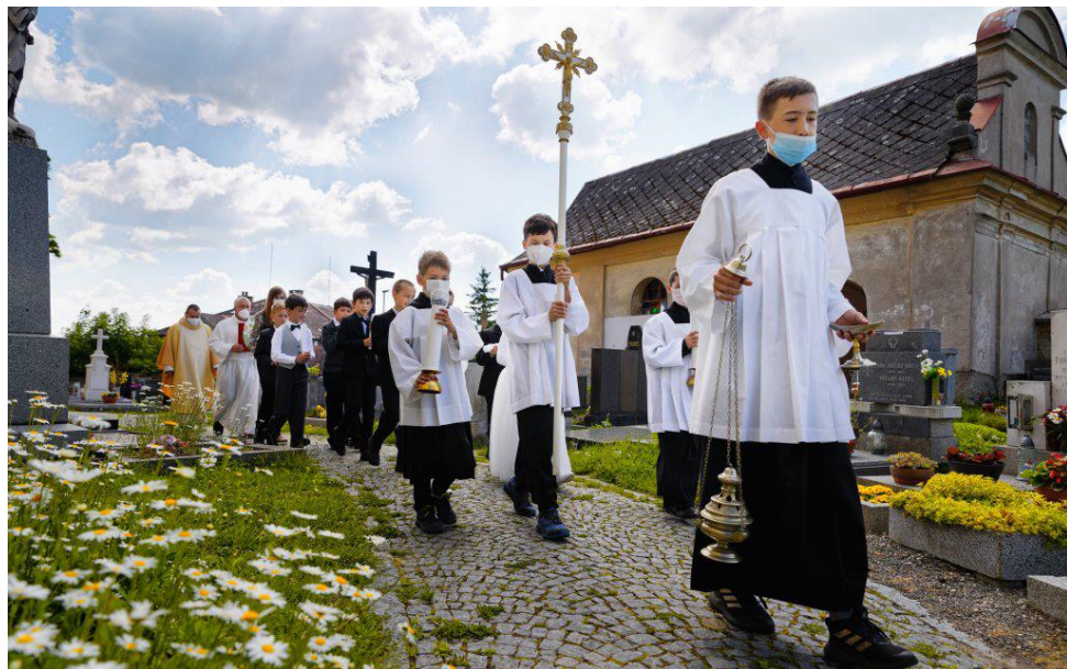
První svaté přijímání (6. 6. 2021)