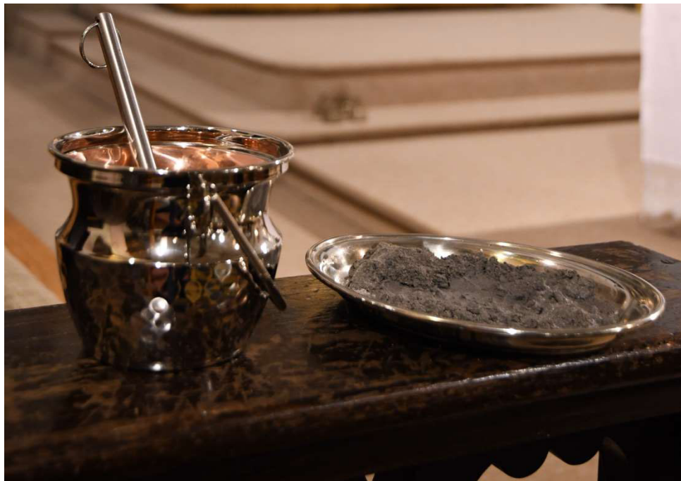
Popeleční středa (17. 2. 2021)