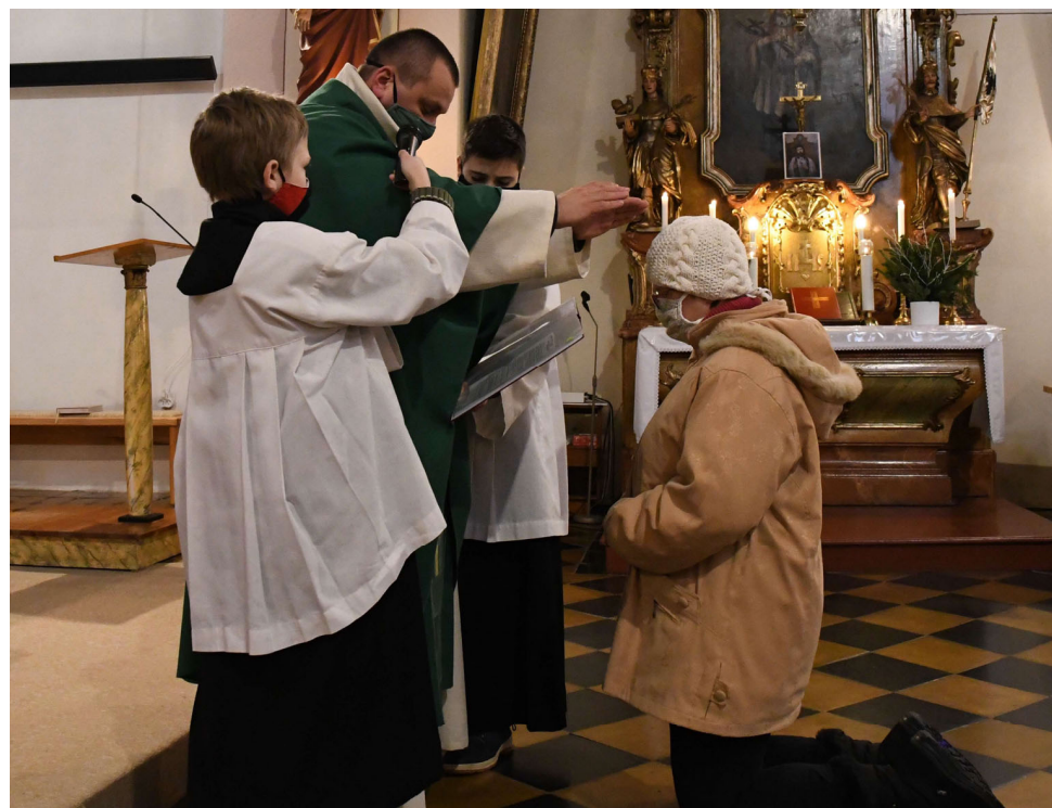
Obřad pověření k výpomoci donášení sv. přijímání nemocným (14. 2. 2021)