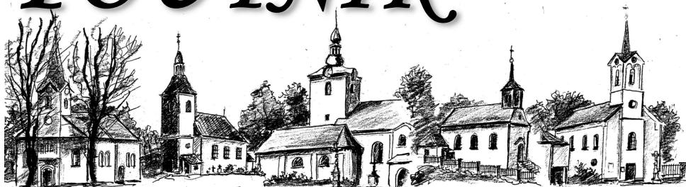
HORÁŇ ČERANŮV – MARIÁŇSKÁ HORA POUTNÍ KOSTEL – MARGRÉT – P. MARIE