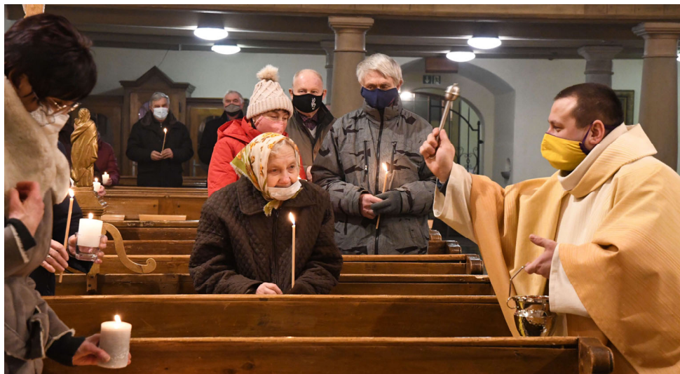
Svátek Uvedení Páně do chrámu - Hromnice (2. 2. 2021)