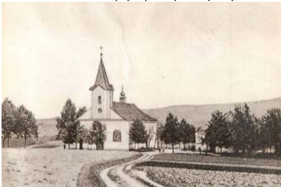
Pohled z roku 1885

Na hlavních dveřích této kaple jsou posud 3 prázdné výklenky, do nichž zakladatel chce dáti do prostředního sochu Panny