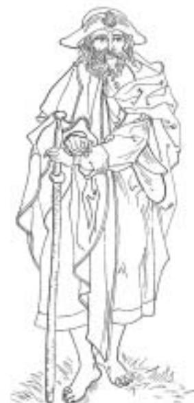
Apokal. 1, 12-16

Sv. Jakub je obvykle zobrazován jako starší muž, který má na sobě poutnický oděv, poutnickou láhev u boku, mošnu, na hlavě klobouk s mušlí (mušle, zv. svatojakubská sloužila původně poutníkům k nabírání vody) a poutními odznaky, v ruce hůl a někdy meč – nástroj umučení.