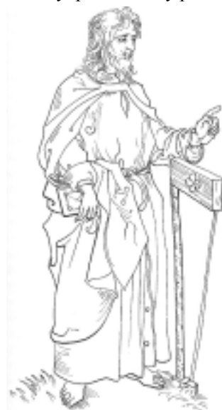
Apoštol sv. Jakub Menší

Sv. Jakub Menší je zobrazován jako muž středního věku, s vousatou tváří. Na Západě se často objevuje ve dvojici s apoštolem Filipem (oba mají společný svátek – tzv. „svatojakubská noc“). V ruce drží