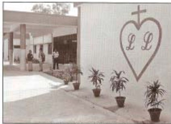
Hlavní vchod do „naší“ nemocnice.