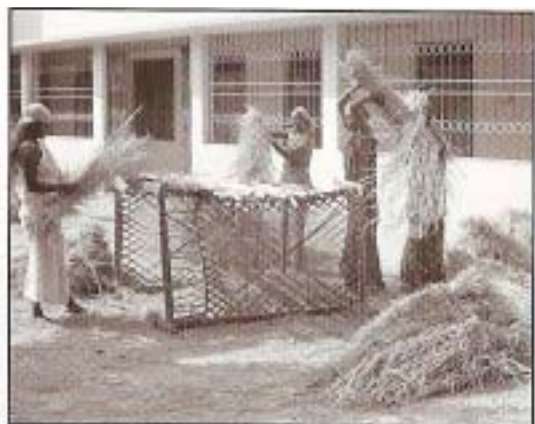
Takto se „mlátí“ rýže z první úrody na „naší“ farmě.

Nadace LL Praha postavila v Indii, která je nejvíce postižena leprou, dvě nemocnice. Jedna je v Bhilajpahari a druhá v Patamdě. Za dva roky své činnosti bylo v nemocnicích úspěšně léčeno přes 50 000 lidí. Tato nemocnice nejen že léčí, ale také v okruhu přes 100 km (i v horách) vyhledávají nemocné leprou a léčí je, nebo sváží do nemocnic. Provoz nemocnic financuje Nadace LL Praha. Odborný zdravotnický personál je z Indie. Potraviny pro nemocné se pěstují přímo v oploceném areálu nemocnice, která je potravinami soběstačná z 90 %. Pěstuje se zde rýže, zelenina, ovoce, chov králíků, slepic a v rybníku ryby atd. Tímto přidruženým hospodářstvím dostává placenou práci i mnoho místních lidí. Při nemocnici se staví i škola pro vzdělávání a dětský domov Ježíšek pro sirotky. Mimo to, nemocnice zajišťují i sociální rehabilitaci. To znamená, že lidé, kteří jsou zmrzačeni leprou dostávají protézy, aby mohli pracovat a vést plnohodnotný život. - Proto budou sbírky pro Nadaci LL nadále pokračovat!