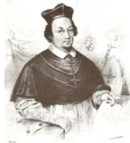
Matouš Ferdinand Sobek z Bílenberka Biskupem 1660-1668

a prosinci jmenoval nového kanovníka hradecký biskup. První kanovníky při nově zřízené kapitule měl právo jmenovat pouze královéhradecký biskup.