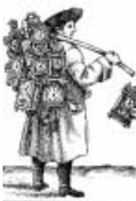
Na Hromnice v hodinu více.