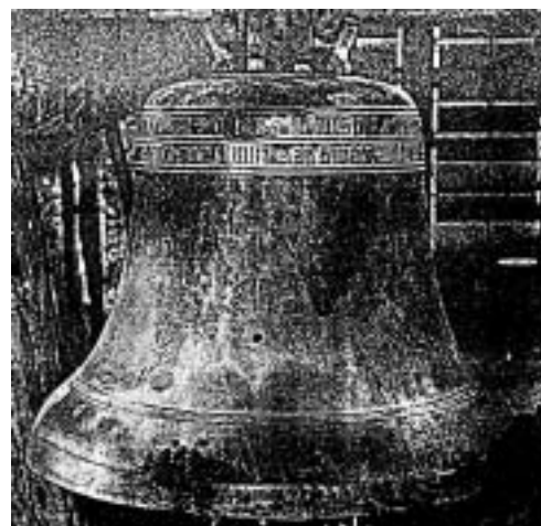
(Zvon sv. Jiří z roku 1536 z farního kostela v Dolní Čermné)