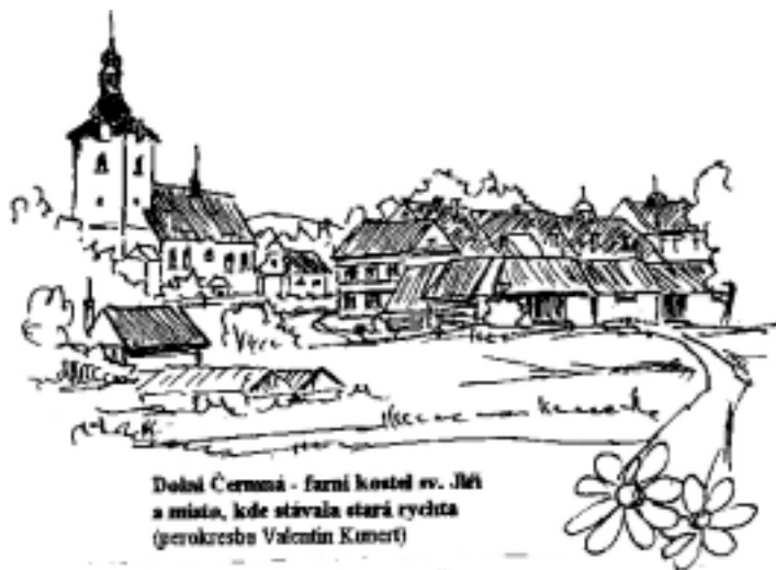
Dolní Čermná - farní kostel sv. Jiří a místo, kde stávala stará rychta (gerokresba Valentin Kucera)

Dále následuje formulace úplného vynětí kláštera a jeho poddaných z obecného práva zemského pod jurisdikci církevní. Konec listiny tvoří právní formulaci, jako u všech podobných nadačních listin, až na plné jméno obdarovaného. Závěrečná část listiny o stvrzení je zajímavá a proto je zde opsána: