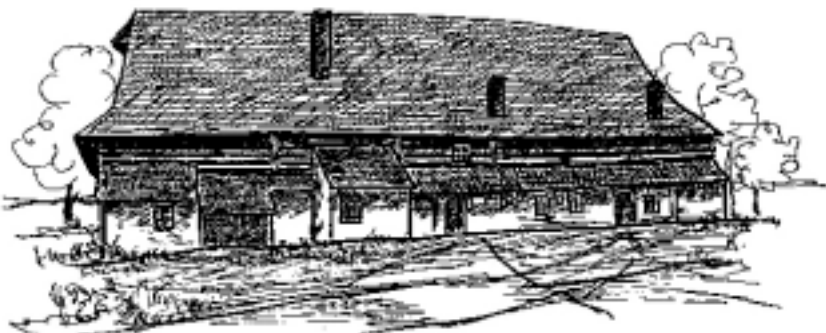
stará čermenská roubená patrová rychta z roku 1720 (perokresba Valentin Kupert)

v tovaryšstvu nepostrádali pomoci vezdejší, ano aby spíše jí podporování prospívali v duchovním životě svém a svobodně Boží službě věnovati se mohli, aby snadněji cítili, že klášter štědotou nadán jest, dole psané statky naše královské za věno tomuto klášteru zbraslavskému dali jsme a dáváme, udělili jsme a udělujeme ze zvláštní milosti chtějíce, aby opat a bratři téhož kláštera, kteří nyní jsou, a kteří i budoucně budou, tyto statky co své vlastní navždy drželi a měli svobodně v míru a v pokoji. Tyto statky kázali jsme tu jmény poznamenati, aby toto od nás učiněné nadání během času z paměti nevyšlo.