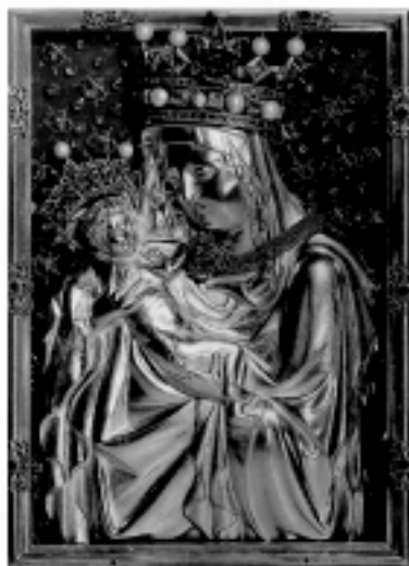
PALLADIUM ZEMĚ ČESKÉ

Vezměme si například období třicetileté války. Švédové po obsazení Staré Boleslavi zničili chrám sv. Václava, který stál na místě vraždy světcovy, několik desítek metrů odtud, všechno cenné, co ve Staré Boleslavi bylo, sebrali a odvezli, tedy i tento zázračný reliéf Panny Marie. Chtěje jej co nejvíce tupit, přibíli jej na staroměstském náměstí na dřevo šibenice, posmívali se Panně Marii na reliéfu, dokonce na ni plivali. Jedna Pražanka ve své horlivosti vykřikla prosbu o potrestání svatokrádežníků. Všichni kolem čekali, že bude okamžitě popravena, ale to se nestalo. Naopak. Bratr nového majitele tohoto obrazu byl krátce nato popraven právě pod touto