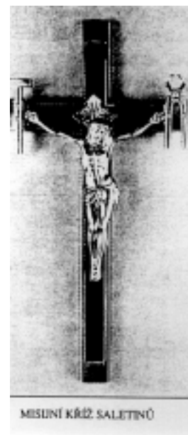
MISIJNÍ KŘÍŽ SALETINŮ

Misionáři Matky Boží z La Saletty Havlíčková 589/40 293 01 Mladá Boleslav