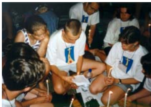
PŘI SOBOTNÍ KŘESTNÍ VIGILII SE SVATÝM OTCEM