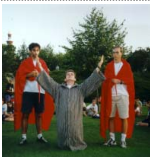
MEZINÁRODNÍ KŘÍŽOVÁ CESTA

„Milovaní chlapci a děvčata z České republiky, ze Svatého Kopečku, necht' nová dynamika, se kterou jste se setkali při tomto Dni mládeže, vás učiní vynálezavými šířiteli Evangelia a rozhojní vaši službu pro bratry“.