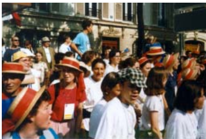
SEŠLI JSME SE, ABYCHOM UTVOŘILI ŘETĚZ PŘÁTELSTVÍ