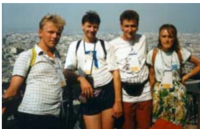
VÝSTUP NA EIFFELOVKU JSME SI NEMOHLI NECHAT UJÍT