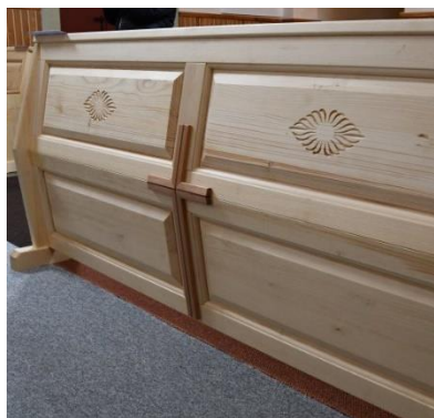
Verměřovice – žehnání nových lavic a sedes 13. 11.

S sebou prosím finanční příspěvek na využití sálu (cca 20 Kč, v případě že budeme topit cca 50 Kč), obuv na přezutí a kdo má, tak florbalovou hokejku, jinak jsou k zapůjčení. Těším se na společně prožitý čas 😊! (Mohu odvézt, přivést. Nebojte se ozvat 😊.)