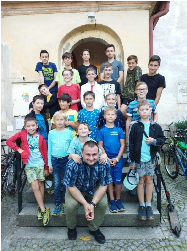
Ministrantská schůzka, pátek 10. 9.